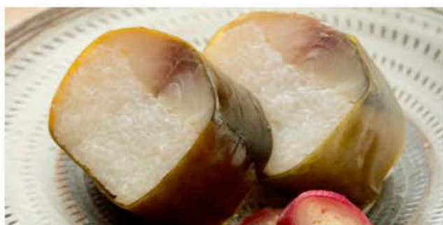
スペシャリテ鯖寿司 EnYaa Spécialité Sushi de maquereau entier (8 pièces) 44€ / demi (4 pièces) 22€

お弁当、味噌汁、デザート付き / Bentô au choix, soupe miso et dessert au choix. 京抹茶のアイス or 季節のフルーツ盛合せ or 焙じ茶のプリン - Glace au thé vert de Kyoto - Assortiment de fruits de saison - Flan au thé grillé et caramel