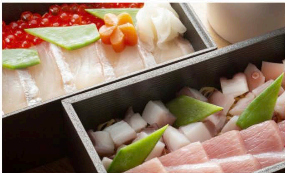
ENYAA特製ちらし寿司 Sushi "Chirashi" façon ENYAA 60€