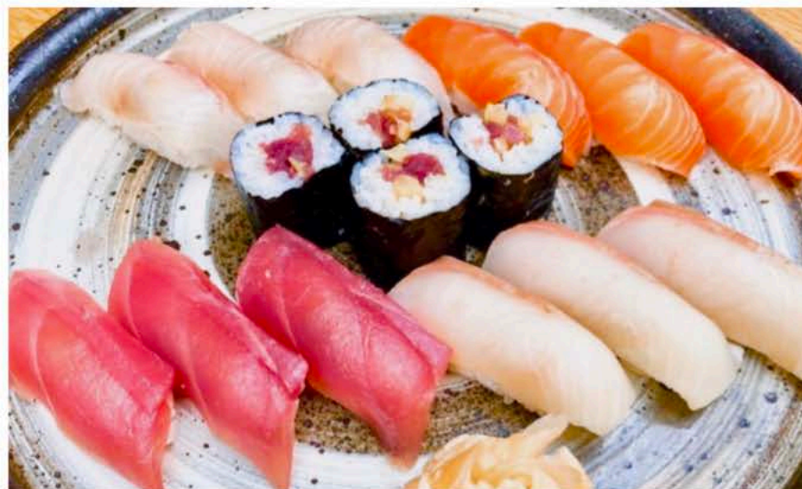
握り寿司盛合せ 16貫 Assortiment Sushi "Nigiri" 16 pièces 60€

お弁当、味噌汁、デザート付き / Bentô au choix, soupe miso et dessert au choix. 京抹茶のアイス or 季節のフルーツ盛合せ or 焙じ茶のプリン - Glace au thé vert de Kyoto - Assortiment de fruits de saison - Flan au thé grillé et caramel